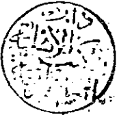
صورة عنوان المخطوط