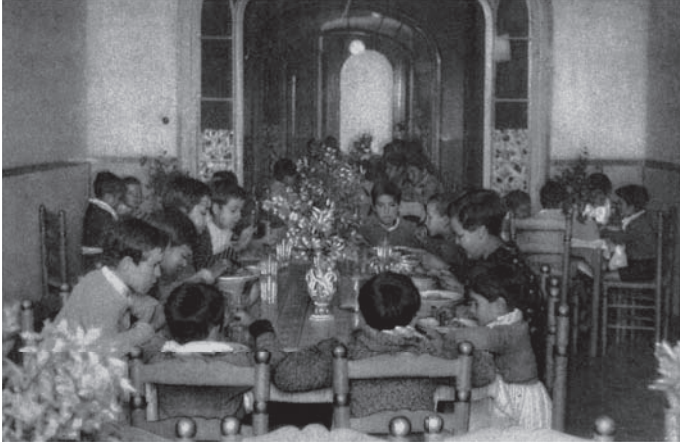
شكل ٦-١: وقت الطعام في إحدى مدارس فيرير بكتالونيا. بعد ثورة ١٩٣٦، التحق ما لا يقل عن ٦٠ ألف طفل بمدارس فيرير. 1

جميع أكباش الفداء غير المحتملة. تلا ذلك نظام جديد للتدخل غير المسبوق من جانب الحكومة المركزية في إدارة ومناهج المدارس الابتدائية والثانوية التي تمولها في بريطانيا السلطات المحلية. اشتمل هذا على فرض منهج تعليمي قومي، لأول مرة، على يد الحكومة المركزية، وبرنامج مستمر لاختبار الأطفال في أعمار معينة، وفيض من الاستثمارات يملؤها المعلمون. (أثبت هذا التقييم اللانهائي دون شك أن المدارس في المناطق الثرية تحقق درجات أعلى من المدارس الموجودة في المناطق الفقيرة؛ حيث اللغة الأم لغالبية الأطفال ليست الإنجليزية. هذه حقائق اجتماعية يدركها بالفعل معظم الناس.)