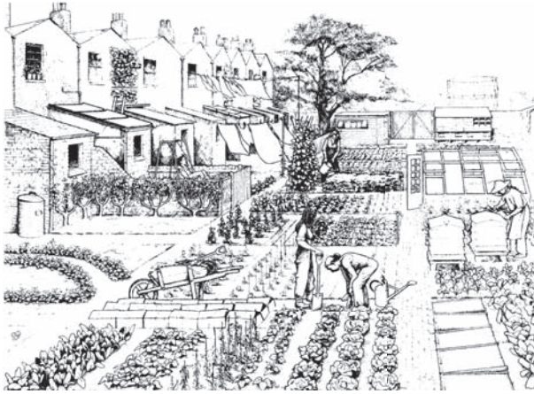
شكل ١٠-١: الحدائق المجتمعية، كما تخيلها كليفورد هاربر. 1

لقد أثبت لنا مؤلفون مثل موراي وبوكتشين وآلان كارتر بشكل قوي أن اللاسلطوية هي الأيديولوجية السياسية الوحيدة القادرة على مجابهة التحديات التي يفرضها وعينا البيئي الجديد على النطاق المقبول من الأفكار السياسية. لقد أصبحت اللاسلطوية أكثر ارتباطاً على نحو متزايد بالقرن الجديد.