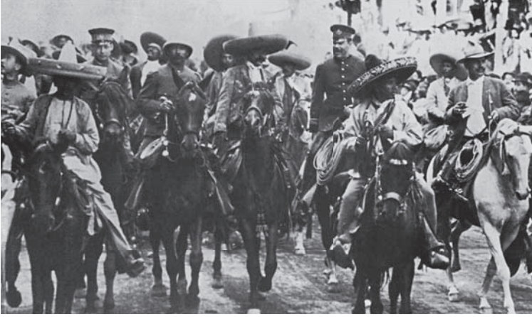
شكل ٢-٢: إيميليانو زاباتا وبانشو فيلا يمتطيان جواديهما في طريقهما إلى مكسيكو سيتي عام ١٩١٤، بعد طردهما للجنرال ويرتا. وقد تم الإيقاع بزاباتا واغتياله عام ١٩١٩. 2

مالايتستا، الذي مات خلال خضوعه للإقامة الجبرية في إيطاليا في أثناء حكم موسوليني، حملات من الدعاية اللاسلطوية في إيطاليا وأمريكا اللاتينية، والتي ما زالت تتدفق حتى يومنا هذا في صورة انتشار مبهر للمطبوعات والحملات.