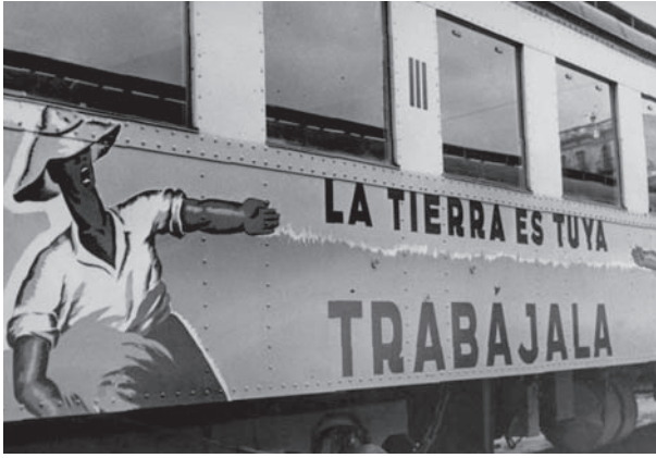
شكل ٢-٦: «الأرض أرضك: ازرعها!» شعار ملصق على قطار في كتالونيا عام ١٩٣٦. 5

من الواضح أنه خلال سنوات المنفى، كرس أولئك اللاسلطويون الذين نجوا من الحرب ومن انتقام فرانكو مجادلاتهم المتواصلة لتناول القرار المهلك الذي اتخذته قادة الاتحاد الوطني للعمل بأن يصبحوا جزءاً من الحكومة في محاولة لمقاومة الهيمنة السوفييتية. وبما أن كل تيار لاسلطوي عارض هيكل السياسة والنظام السياسي، فقد مثّل هذا القرار حلّاً وسطاً لم يجلب معه أية فائدة وإنما كثيراً من العار. يميل أولئك اللاسلطويون الذين درسوا الأمر إلى الاتفاق مع تعليق اللاسلطوي الفرنسي المحنك سيباستيان فور: «أنا وإعٍ بحقيقة أنه من غير الممكن دائماً أن يفعل المرء ما يجب أن يفعله، ولكنني أعلم أن هناك أفعالاً لا ينبغي للمرء أبداً أن يرتكبها تحت أي ظروف.» وبعد عقود، أعادت سلسلة جديدة من الانتفاضات الشعبية اكتشاف الشعارات اللاسلطوية في تحدٍّ بطولي لإمبراطورية ستالين القوية ظاهرياً. وظهرت الطموحات المكبوتة في شوارع المدن المجرية والبولندية عام ١٩٥٦، وفي تشيكوسلوفاكيا عام ١٩٦٨. كانت هذه كلها بشائر للسقوط غير الدموي اللاحق للاتحاد السوفييتي، بعد عقود من المعاناة المرعبة التي عاشها أولئك الذين فشلوا — عادةً دون قصد — في إرضاء حكامهم.