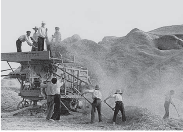
شكل ٢-٥: درس الذرة في مزرعة بأراجون، استولى عليها عمالها عام ١٩٣٦. 4

من أولئك الذين تجرّءوا على معارضة فرانكو؛ فكانت هناك أعداد لا تُحصى من أحكام الإعدام، وامتألت السجون، وعاش ملايين الإسبانين حياتهم في المنفى.