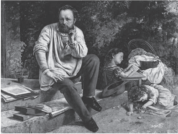
شكل ١-٢: بيير جوزيف برودون (١٨٠٩-١٨٦٥)، من لوحة «برودون وأبناؤه» (١٨٦٥) بيد جوستاف كوربيه. 1

وسعى من خلال سلسلة طويلة من الكتب والكتيبات إلى إكساب اللاسلطوية أساساً علمياً. كان كتاب «الاستيلاء على الخبز» (١٨٩٢) دليhle الإرشادي للتنظيم الذاتي في مجتمع ما بعد الثورة. أما كتاب «المساعدة المتبادلة» (١٩٠٢)، فقد ألّفه لمواجهة تلك التفسيرات الداروينية الخاطئة التي دافعت عن الرأسمالية التنافسية؛ فأثبت من خلال ملاحظة المجتمعين الحيوانيين والإنساني أن المنافسة بين الأجناس أقل أهمية من التعاون كمتطلب أساسي للبقاء.