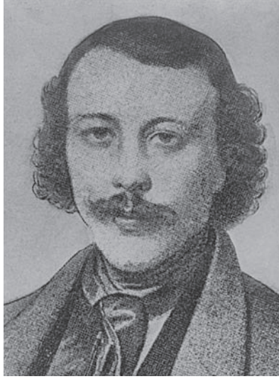
شكل ١-٣: ميخائيل باكونين (١٨١٤-١٨٧٦)، بورتريه في باكر حياته.

محلي حاول تدبير وسيلة للوصول إلى منابر الصحافة، واعيًا بتيار اللاسلطوية الخفي في كل انتفاضة للمضطهدين على مدار التاريخ، وجعبته مليئة بأفكار عن تطبيق الحلول اللاسلطوية على المشكلات والمعضلات المحلية. كما سيكفون الانتباه إلى الطريقة التي يمكن بها رصد الطموحات اللاسلطوية في ثورات العبيد في العالم القديم، وانتفاضات الفلاحين في القرون الوسطى، وأهداف جماعة الحفارين في الثورة الإنجليزية في أربعينيات القرن السابع عشر، والثورات الفرنسية في عامي ١٧٨٩ و١٨٤٨، وكومونة باريس في عام ١٨٧١. وفي القرن العشرين، لعبت اللاسلطوية دورًا في الثورة المكسيكية عام ١٩١١، والثورة الروسية عام ١٩١٧، والأبرز هي الثورة الإسبانية عقب الانتفاضة العسكرية التي عجلت باشتعال الحرب الأهلية في عام ١٩٣٦. أما الدور الذي لعبه اللاسلطيون في هذه المواقف الثورية فسنعرضه في الفصل القادم.