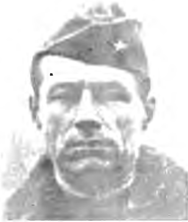
وليم ميتشل (١٨٧٩ - ١٩٣٦)