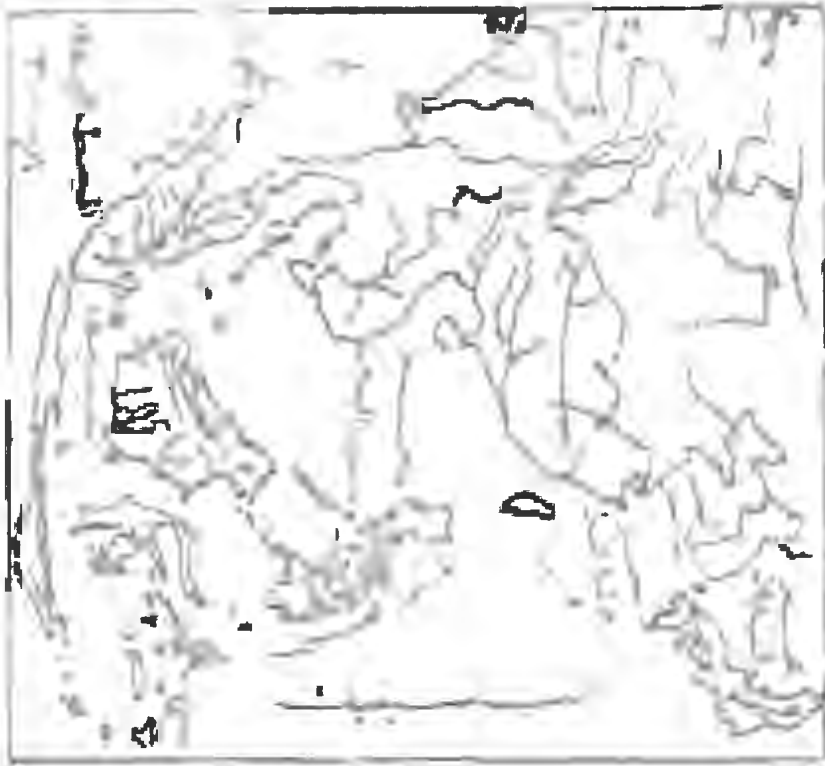
منطقة العمليات اليابانية في الحربين العالميتين