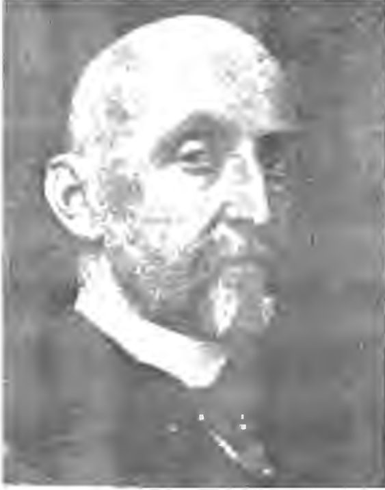
الفريد ثاير ماهان ضابط بحري ومؤرخ (١٨٤٠-١٩١٤)