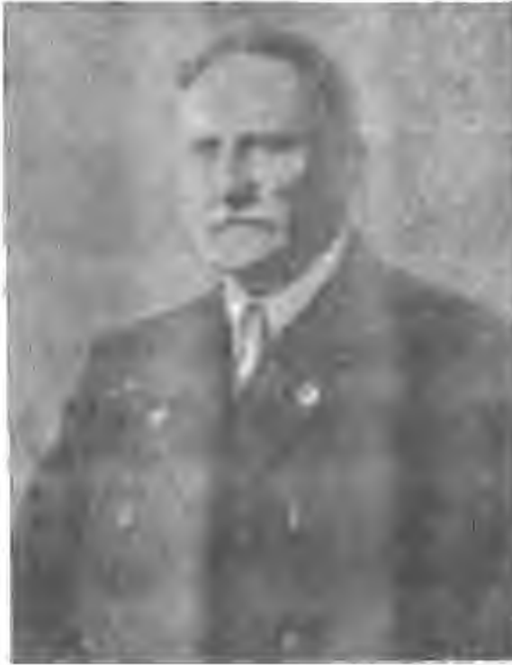
چنرال کارل هوزهوڤر