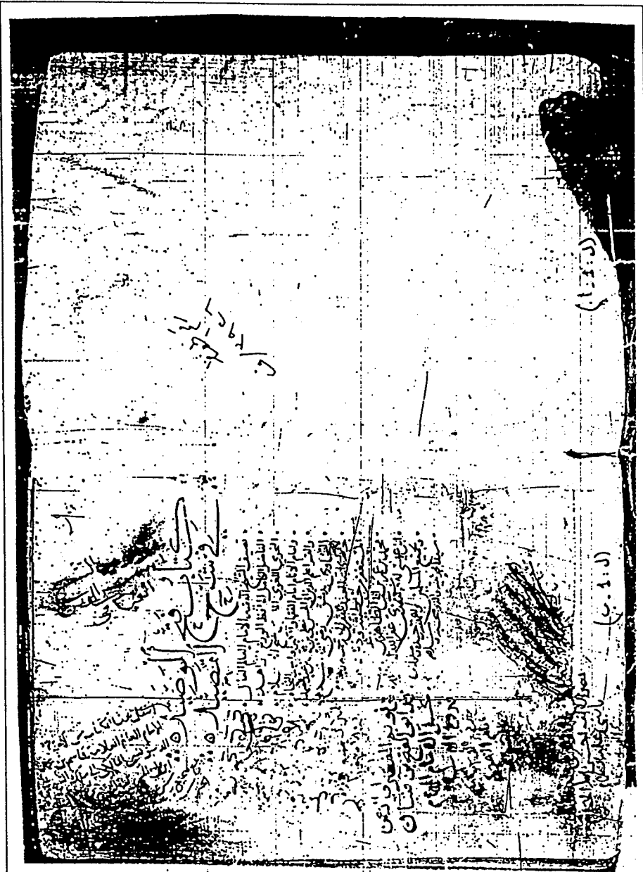
لوحة العنوان للنسخة الأصلية المروزها لها بـ(ص)