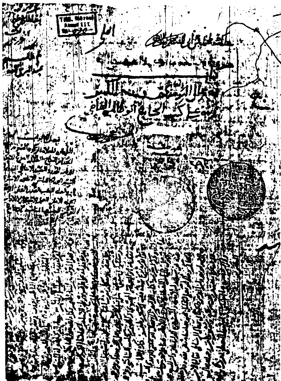
صورة الورقة الأولى من النسخة الخطية