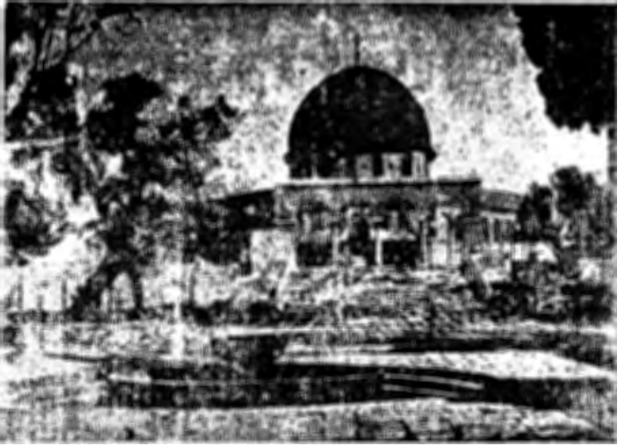
( شكل ١ ) قبة الصخرة في المسجد الأقصى