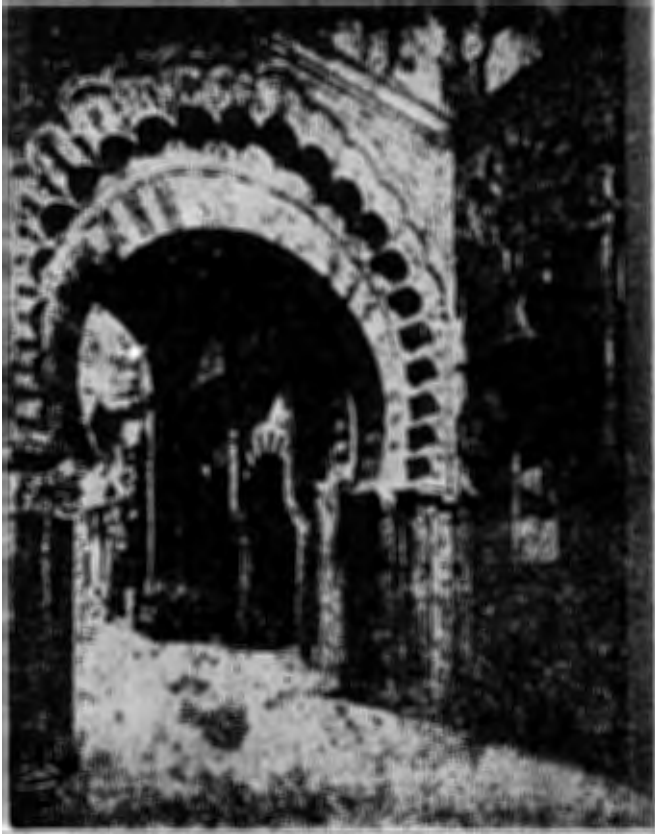
( شكل ٦ ) داخل مسجد قرطبة