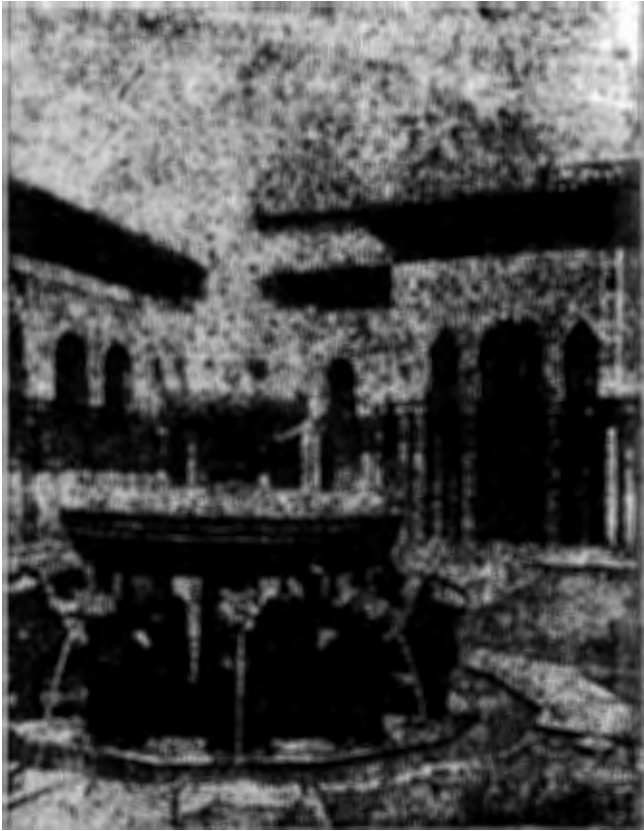
( شكل ٧ ) بهن السباع في قصر الحمراء نغرباطه