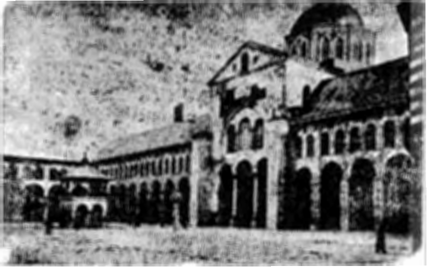
( شكل ٣ ) المسجد الأموي بدمشق