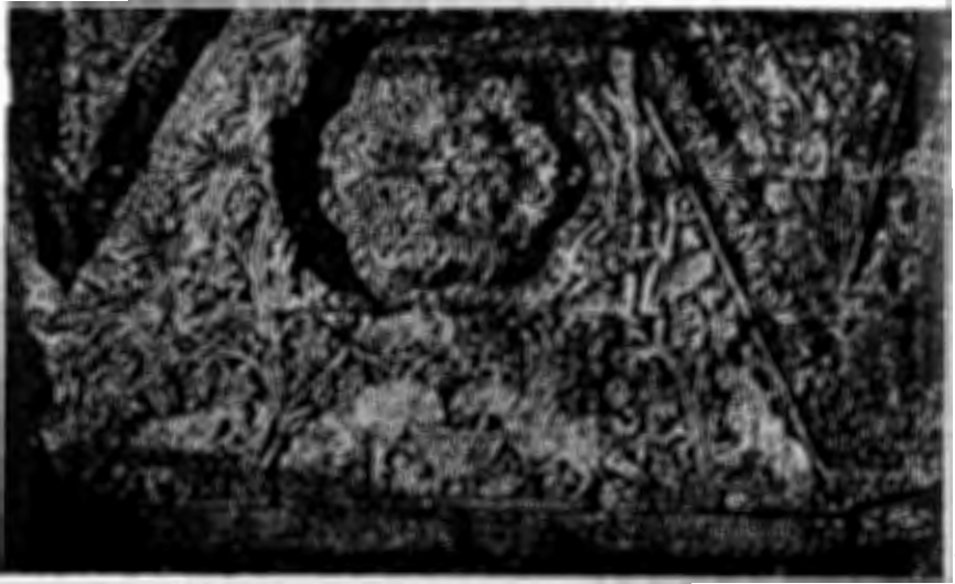
( شكل ٤ ) نقش بارز هل الصخر ببلاد الشام