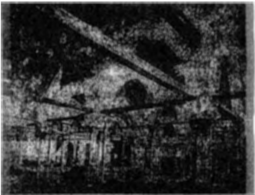
( شكل ه ) صحن الجامع الأزهر بالقاهرة