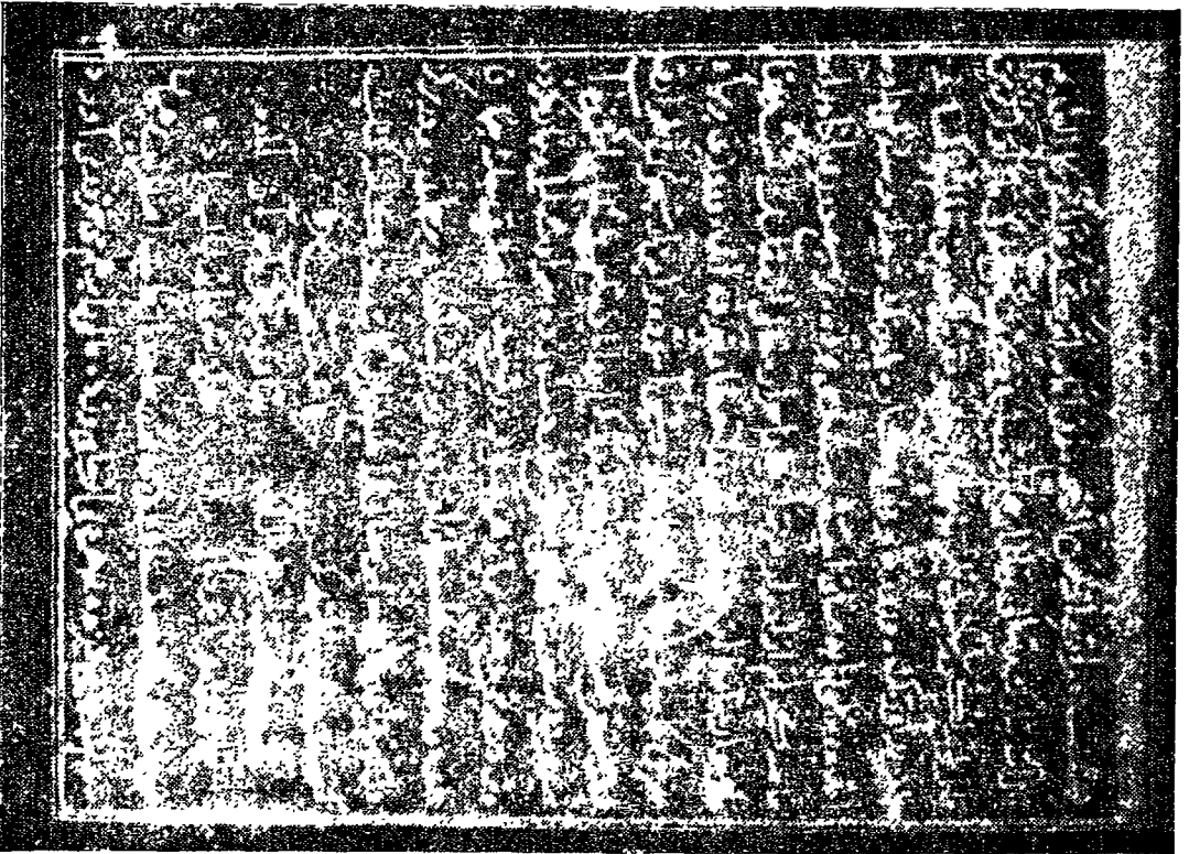
صورة للورقة الأولى من مخطوط «مسألة تسليمة الاخوان المفظوط بالكتابة الالهية بباريس