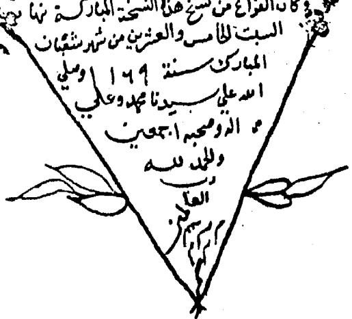
اللوحة رقم (٢) عن مخطوطة برلين (ب ١)

قال المؤلف في الله عن وكان الفراغ من تبين في ربيع الثاني سنة احدى عشر والف والحمد لله رب العالمين وحسبنا الله ونعم الوكيل وصلى الله على النبي الطاهر القائم السيد الاعظم والمريدين والارواح الطاهرة